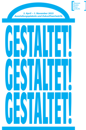
Plakat «Gestaltet!». Gestaltung SNAC Grafik Design und Typografie GmbH, Luzern

Die Bilder zur Ausstellung stehen auf www.museumbruderklaus.ch/medien zum Download bereit. Diese werden laufend aktualisiert.