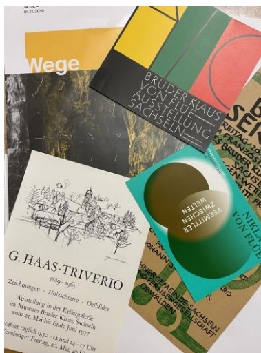
Historische Plakate. Verschiedene Künstler:innen. Sammlung Museum Bruder Klaus Sachseln