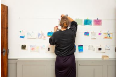
Eine Besucherin gestaltet das Museum mit.