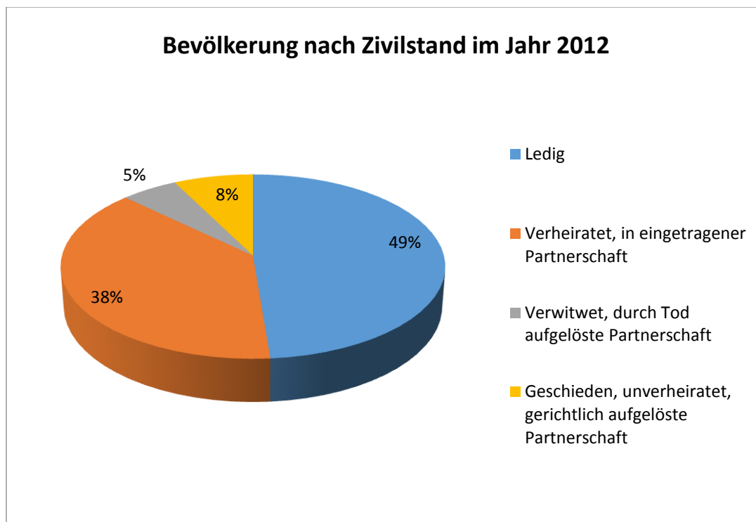
Grafik: Bevölkerung nach Zivilstand 4