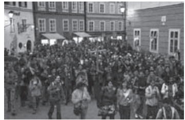
Rückkehr von "Jericho-Marsch"