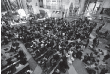
Abend der Barmherzigkeit im Dom

Wir schlossen den Tag mit einem "Abend der Barmherzigkeit" ab, bei dem wir im Dom Anbetung hielten und die Gelegenheit zur Beichte hatten. In den Seitennischen bildeten sich kleine Schlangen vor den Priestern, die an diesem Abend viel zu hören hatten.