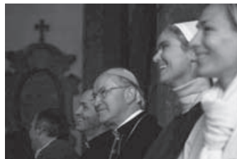
Erzbischof Alois und Schwester Teresia Benedicta

Nach einer kurzen Pause und einer Hl. Messe war bis zum Nachmittag im Kirchenraum Zeit für Stille Anbetung, was auch von zahlreichen Jugendlichen genutzt wurde.