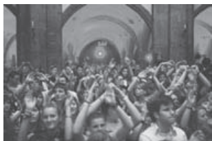
Jugendliche während des Morgenlobes

Am nächsten morgen wurden wir, mehr oder weniger ausgeschlafen, durch Gitarrenspiel und lieblichen Gesang geweckt. Dann trafen wir nach ca. 40 Minuten Fussweg im Innenhof der kath. Hochschule ein, wo unser Zmorge auf uns wartete. Dort sahen wir auch den weiblichen Teil unserer Reisegruppe wieder. Nach dem Frühstück, das üblicherweise nicht jeden Geschmack traf, begaben wir uns zum Morgenlob nach St. Blasien.